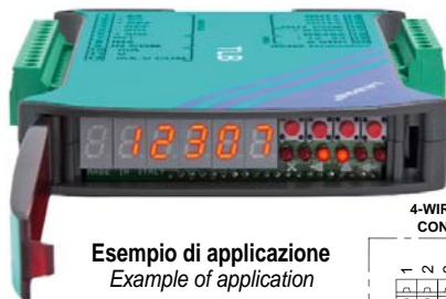
Esempio di applicazione Example of application