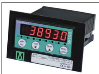
Supporto per etichetta metrica (dimensioni: 124 x 77 x 1.5 mm). Support for metric label (dimensions: 124 x 77 x 1.5 mm).