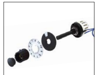
Commutatore per selezione 12 gruppi da 5 setpoint. Selector switch for 12 groups of 5 setpoint.