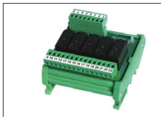
Modulo 5-relé esterno per aumentare la portata dei contatti di scambio a 2A/115Vac. External 5-relay module to increase the capacity of SPDT contacts to 2A/115Vac.